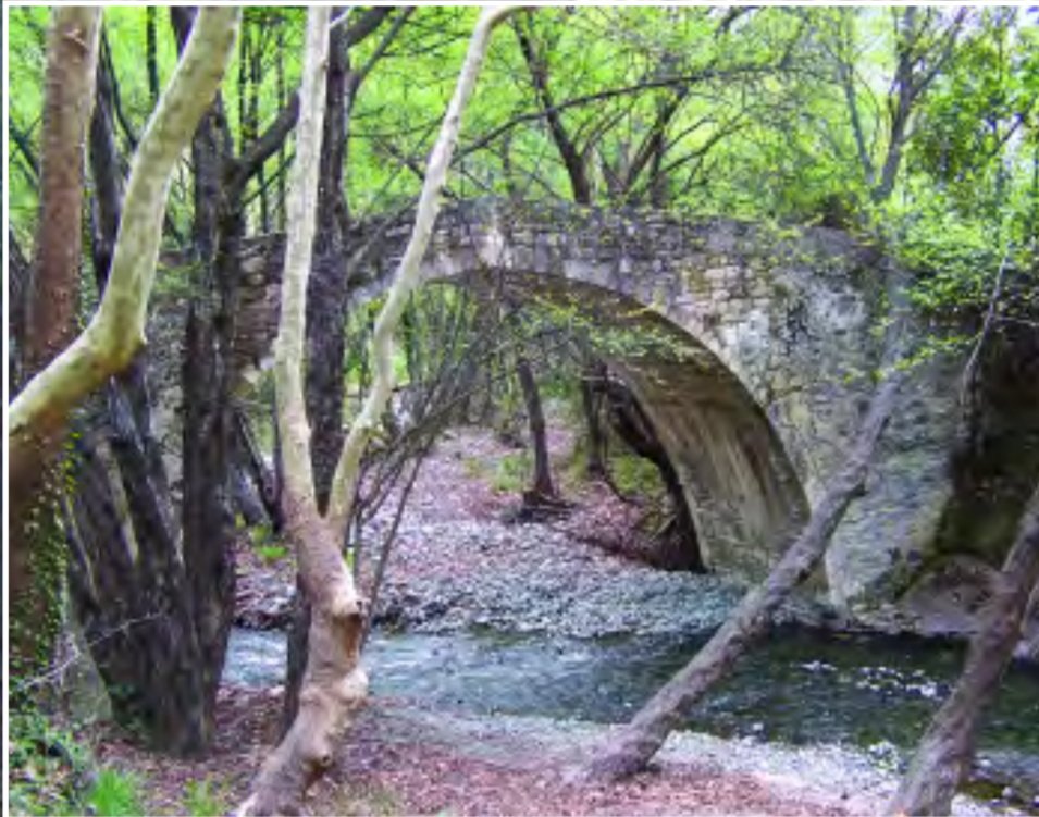
Ξερός ποταμός - Γεφύρι του Ρουδέια Xeros Potamos - Roudhlias Bridge

Τα ποτάμια αποτελούν οικοσυστήματα με μια εξαιρετικά πλούσια και μοναδική βιοποικιλότητα. Πολλά είδη πανίδας έχουν ως κύριο ή αποκλειστικό ενδιαίτημα τους τα ποτάμια. Στο βαθμό που αυτά υποβαθμίζονται, επηρεάζεται αρνητικά και η βιοποικιλότητα που φιλοξενούν.