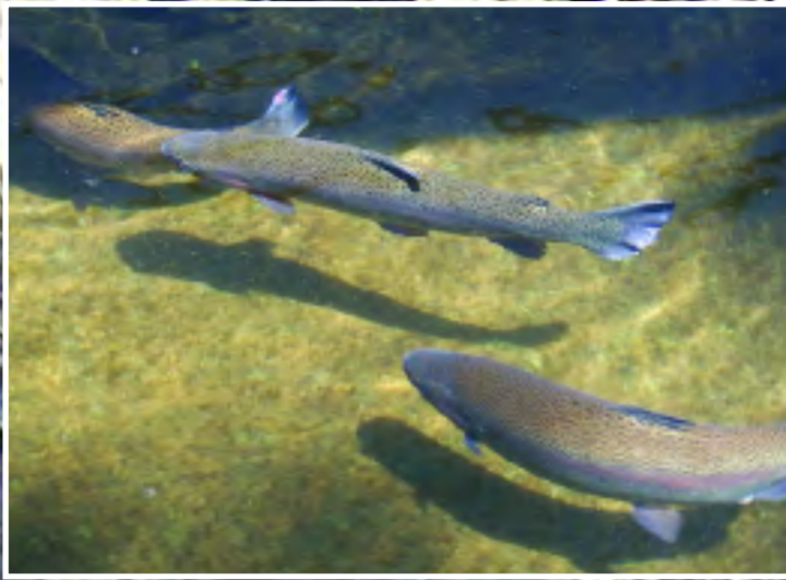
Πέστροφα - Brown trout - Salmo trutta