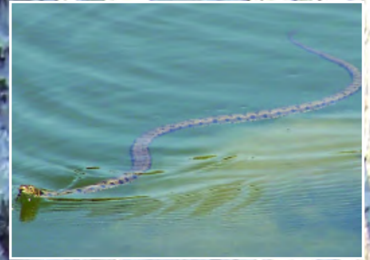
Περόφιδο - Grass snake - Natrix natrix cyriaca