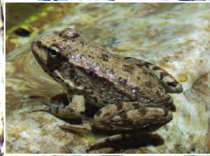
Βαλτόβιος βάτραχος - Marsh Frog - Rana ridibunda