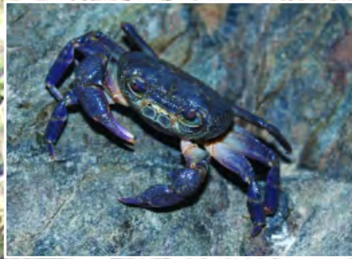
Κάβουρας του γλυκού νερού - Freshwater crab - Potamon potamios