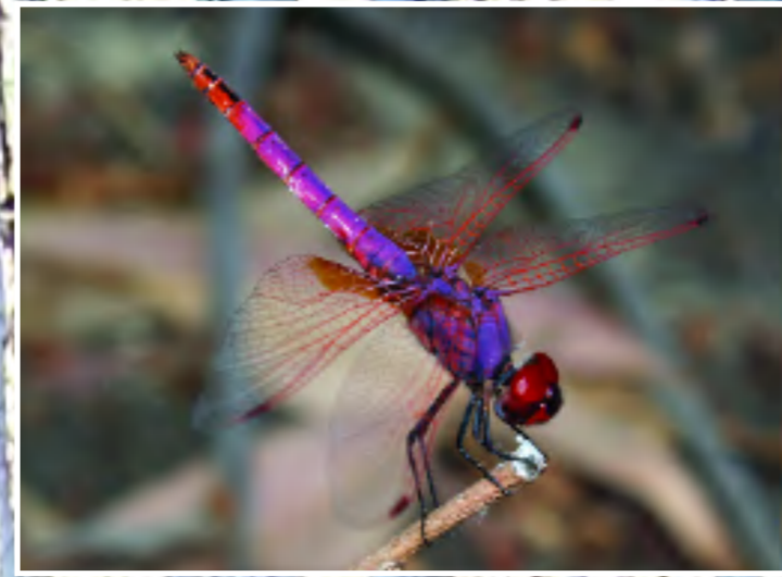
Είκοσπερόκι (Αιζαληρούνη) - Purple-blushed damselfly - Trithemis annulata