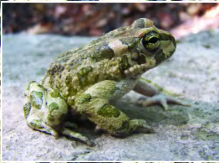
Ιριόξαν βάτραχος - Green Toad - Bufo viridis