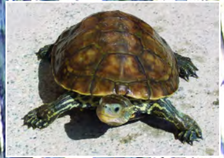
Χελώνα του γλυκού νερού - European pond-turtle - Mauremys caspica rivulata